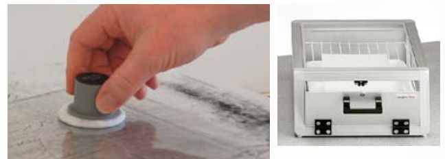
IZQUIERDA: NUEVA TÉCNICA DE ALMOHADILLA PARA TÓNER PARA IMÁGENES MÁS CLARAS DERECHA: HUMIDIFICADOR DE DOCUMENTOS